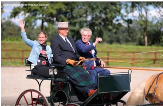
Opening Aeres Hippisch Centrum