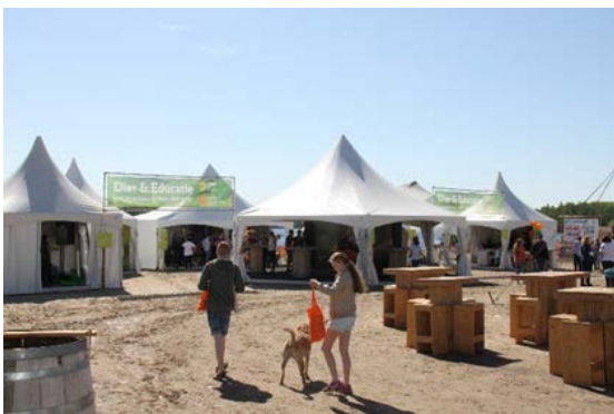
Animal Event 2018