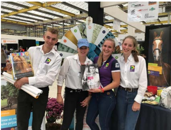
Studenten inzet Horse Event

Studenten participeren op verschillende manieren, zoals in de studentenraad, promotieteam en het excellentieprogramma.