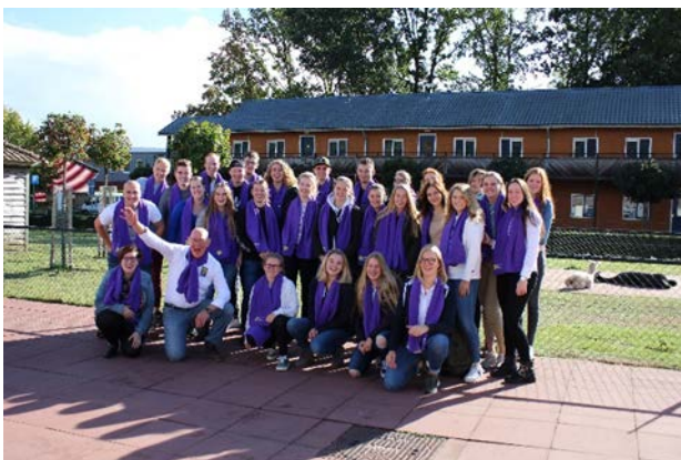
Promotieteam Aeres MBO Barneveld